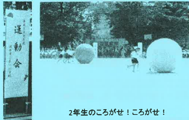
2年生のころがせ!ころがせ!