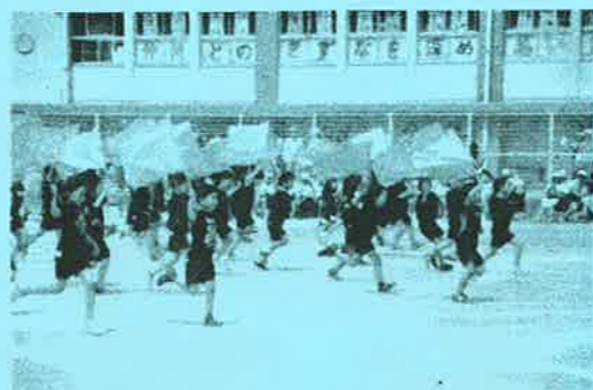
3年生の風をきれフラッグ・フラッグ

第一小学校の運動会が5月23日(土)晴天の中で行われました。今年のためあて「仲間とのきずなを深め、思い出に残る運動会にしよう」の言葉通り、今年入学したばかりの一年生も団体行動になじみ元気な演技を披露しました。恒例の6年生による組体操は、今年もダイナミックな演技、ドラマチックなプレーに多くの歓声を頂きました。校庭の砂で真っ白になって戻ってきた姿は本当に感動的でした。