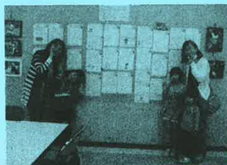
動物へのお手紙を見に来てくれました

4月29日(水)から5月5日(火)まで、たづくりの11階みんなの広場で、3月29日に布多天神境内で開催した「ふれあい動物村」の動物と子どものふれあいの写真、動物たちに書いた手紙や絵、参加者が書いた感想文を展示しました。家族で、市長が、校長先生が、応援してくださった市職員や市民の方が観てくださいました。ユニークで楽しい「動物村」展になりました。