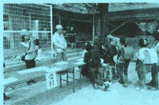
5,6年生に参加してもらいました

ご協力いただいたみなさま、ご参加をいただいた多くの5・6年生の児童や保護者のみなさまに、お礼申し上げます。