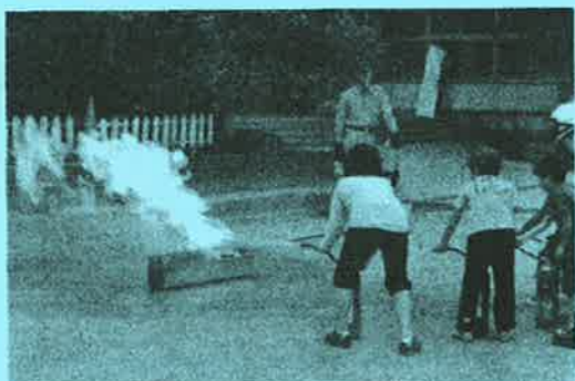
消火器を使用した初期消火訓練