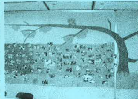
布多天神の森の様子を再現