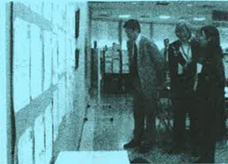
長友市長もご来場