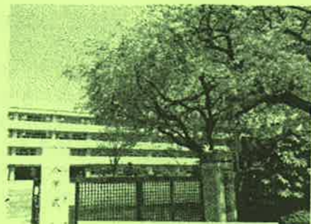
第一小のしだれ桜が満開でした!