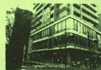
セントラルレジデンス調布