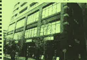
グレースシア調布

北口と南口の再開発ビルがいよいよ開業です。南口のセントラルレジデンス調布は、3月に開業し、順次店舗がオープンしています。また、北口のグレースシア調布でも5月開業に向けて、一部店舗がオープンしています。調布初出店のテナントもあり、ますます駅周辺がにぎやかになりました。