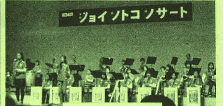
吹奏楽クラブの軽快な音色