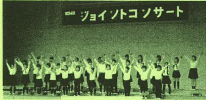
合唱クラブの元気な歌

3月1日(日)今年はずくりくすのきホールで開催されました。合唱クラブのオリジナル音楽劇「星の輝く夜に」や美しい歌声の数々、吹奏楽クラブのジャズナンバーからアニメソングまで幅広いジャンルの演奏、恒例となったOBや父母たちとの合同演奏に会場はおおいに盛り上がりました。