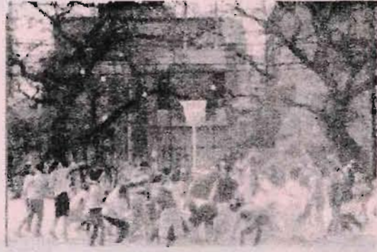
全員参加の玉入れは大人気

10月23日(日)秋晴れの青空の下、一小地域が6ブロックに分かれて大熱戦が繰り広げられました。第一小の子ども達やその家族はもちろんのこと、小さなお子さんをつれた地域の方も多く来場し競技に参加する姿が見られました。