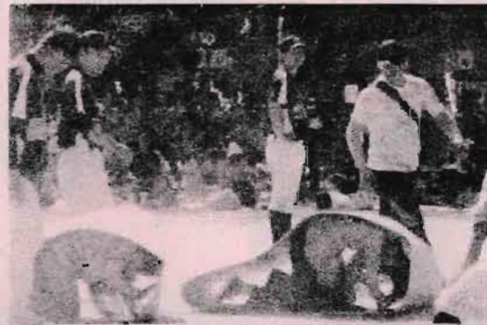
まっすぐ進むのがタイヘンな「いもむしゴロゴロ」