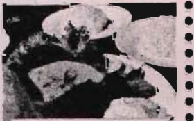
ブラホック・ティス

クメール料理(カンボジア伝統料理)は美味しいですよ。辛すぎず、そして尖りすぎないため、みなさんの想像していたよりも優しい味で、日本人の口に合う、ということ。まず、ご紹介したいのは、魚を発酵させペースト状にした「ブラホック」です。日本でいう味噌や醤油のような存在のブラホックは、スープやカレーなど、クメール料理の味付けに使われます。