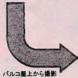
バルコニー上から撮影