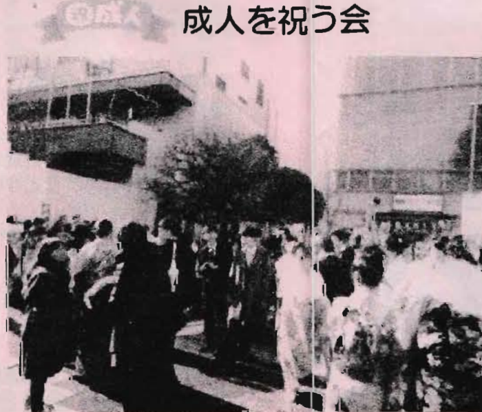
開発工事中で狭くなった駅前広場に集う新成人たち

1月9日(月)グリーンホールで成人式が開催されました。成人を迎えたのは2,178人(男性 1,133人、女性 1,045人)同級生や先生と会い懐かしい歓声があがり、中学8校有志による「成人を祝う会」や健全育成など地域のみなさんに迎えられる、成人になった自覚と喜びをかみしめていました。