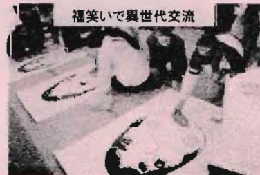
福笑いで異世代交流