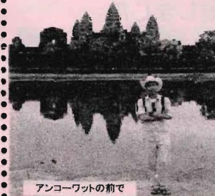
アンコールワットの前に

アンコールワットは「1度は行ってみたい世界遺産ランキング」で常に上位に入るほど人気があります。アンコールワットを目的にカンボジアを訪れる人がほとんどだと思います。アンコールワットは1113年に完成し、寺院、宮殿、霊廟のすべての役割を果たしており、ヒンズー教のヴィシュヌ神が祀られています。レリーフのなかでも秀逸の匠の技といえは透かし彫りが美しく、奥行きのある立体的な彫刻は見事のひとつという魅力があります。その美しい彫刻はアンコールワットの西塔門の内側の上部、十字回廊の中央北側の柱などで見られます。緻密な造りで細かい彫刻がびっしりという印象のアンコールワットですが、実はそのほかに見えない所で手抜きがいっぱいあります。