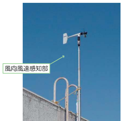
○大気汚染の調査イメージ