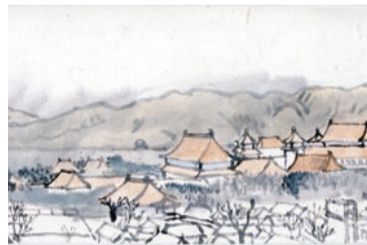
武者小路実篤「北京風景」1943年4月

全国を訪れた実篤の各地での出会いや経験を日記や手紙に残る記録と滞在先で書かれた作品から探ります。 日 1月27日(日)まで