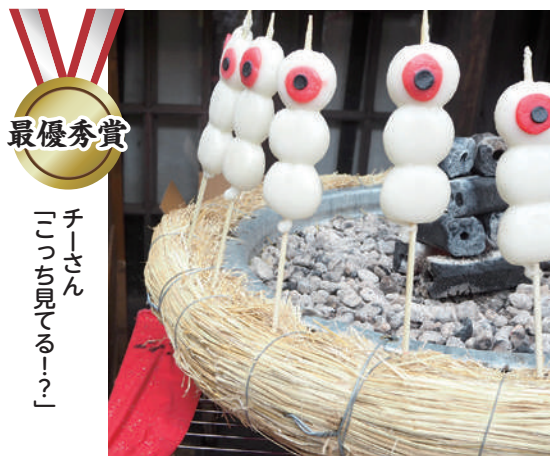
最優秀賞 チーさん 「こっちは見てる!」

「世界に向けて発信したい、調布の今」をテーマに応募いただいた51作品から二次審査に進んだ12作品の中で、市公式フェイスブック・インスタグラムで「いいね」を多く獲得した作品(最優秀賞と優秀賞)と特別賞(FC東京賞とラグビー賞)が決定しました。 調広報課☎481-7301