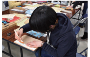
前回の製本講座の様子

本を形作る部品の名称や役割、本の構造を知り、本づくりの楽しみを経験する講座です。 期 ①2月6日(休)②13日(休) 時 午後2時～4時 所 北部公民館 図 製本の基礎となる文庫本の改装と平綴じ製本 定 16人(多数抽選) 費 1650円 申 往復はがきに講座名、応募者全員(1枚2人までの郵便番号、住所、氏名(ふりがな)、年齢、電話番号を明記し、1月23日(出)必着)までに実篤記念館へ。締切後、定員に空きがある場合は1月24日(出)午前9時～2月5日(出)午後5時に電話で受け付け(先着順)