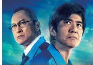
「Fukushima 50」(フクシマフィフティ) 3月6日(金)全国公開 配給:松竹 KADOKAWA