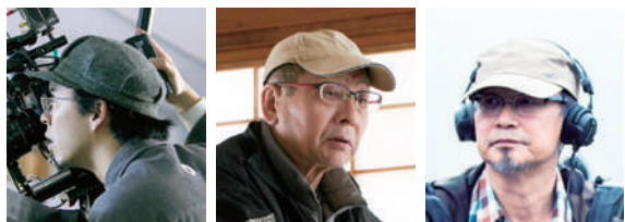
撮影賞:今村圭佑 照明賞:水野研一 録音賞:鈴木 肇