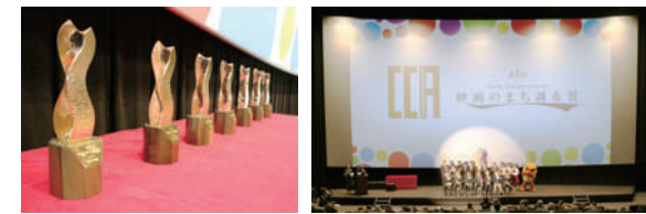
所 調布市イオンシネマ シアタス調布 ☎490-0039(音声自動ダイヤル) (文化生涯学習課)