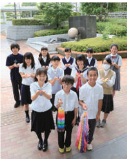
ちょうふピースメッセンジャー2019の中学生たち

広島平和派遣に参加した中学生「ちょうふピースメッセンジャー2019」の平和への想いが込められたメッセージボードを、市内イベントや公共施設などで展示しています。2月下旬から3月末にかけては、市内3カ所の公民館で巡回展示を行います。 ● 北部公民館／2月21日(金)～3月1日(日) ※2月24日(休)休館 ● 東部公民館／3月4日(火)～15日(日) ※9日(月)休館 ● 西部公民館／3月18日(水)～29日(日) ※23日(月)休館 ●会場により展示内容が変更になる可能性あり ●文化生涯学習課 ☎481-7139