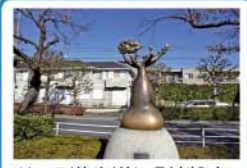
1kmの遊歩道に彫刻9点、モニュメント1点を展示。