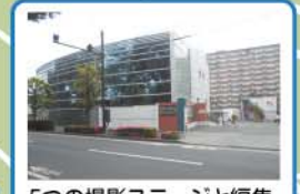
5つの撮影ステージと編集・録音を行う設備があります。