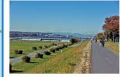
多摩川に沿って土手に遊歩道が造られています。