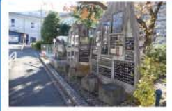
調布における映画産業の歴史を記念して建立。