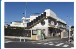
多摩川周辺の自然環境を紹介する環境学習施設です。 ※9時~17時。入館無料。無休。