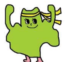
ふーちゃん 調布市民健康づくり マスコットキャラクター