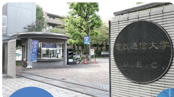
電気通信大学正門