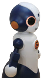
対話型ロボットSota(ソータ) Sota(ソータ)はヴイストン株式会社の登録商標です

ほかにも、「プログラミング教室(小学5年~高校3年生)」「理系の古文書講座」「ハイデガー『存在と時間』を読む」など知的好奇心をくすぐられる企画が年間を通じて用意されています。