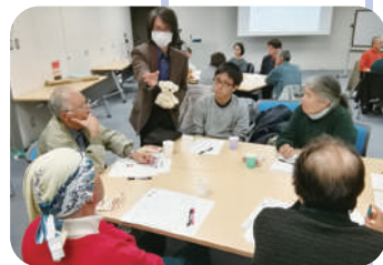
サイエンスカフェChofu

電通大だけでなく、市内や近隣にある大学・研究機関の研究者と、身近なテーマでサイエンスの楽しさについて気軽に話し合うことができます。