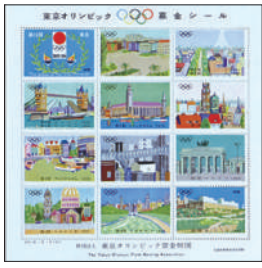
東京オリンピック募金シール