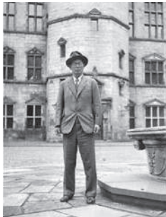
「欧米旅行先にて」(昭和11年)